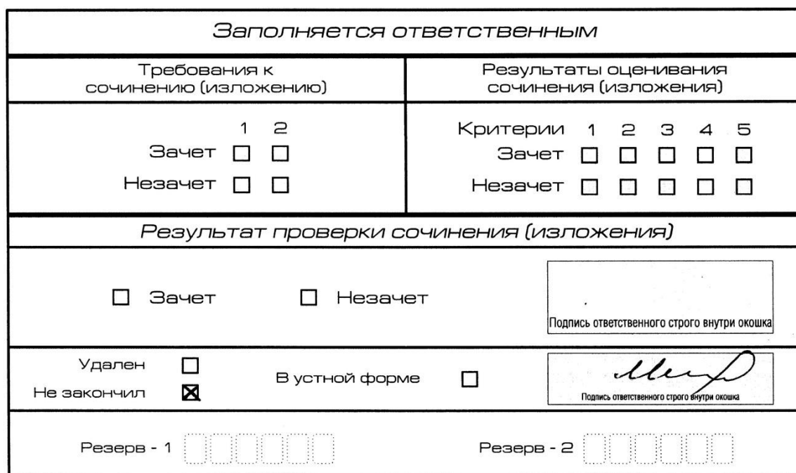
Рис. 12. Заполнение полей нижней части бланка регистрации (участник не закончил написание сочинения (изложения) по уважительным причинам)

В случае если участник итогового сочинения (изложения) по состоянию здоровья или другим объективным причинам не может завершить написание итогового сочинения (изложения), он может покинуть место проведения итогового сочинения (изложения). Члены комиссии по проведению итогового сочинения (изложения) составляют «Акт о досрочном завершении написания итогового сочинения (изложения) по уважительным причинам» (форма ИС-08), вносят соответствующую отметку в форму ИС-05 «Ведомость проведения итогового сочинения (изложения) в учебном кабинете ОО (месте проведения)» (участник итогового сочинения (изложения) должен поставить свою подпись в указанной форме). В бланке регистрации указанного участника итогового сочинения (изложения) необходимо внести отметку «Х» в поле «Не закончил» для учета при организации проверки, а также для последующего допуска указанных участников к повторной сдаче итогового сочинения (изложения) в дополнительные сроки. Внесение отметки в поле «Не закончил» подтверждается подписью члена комиссии по проведению итогового сочинения (изложения) (см. рис. 12).